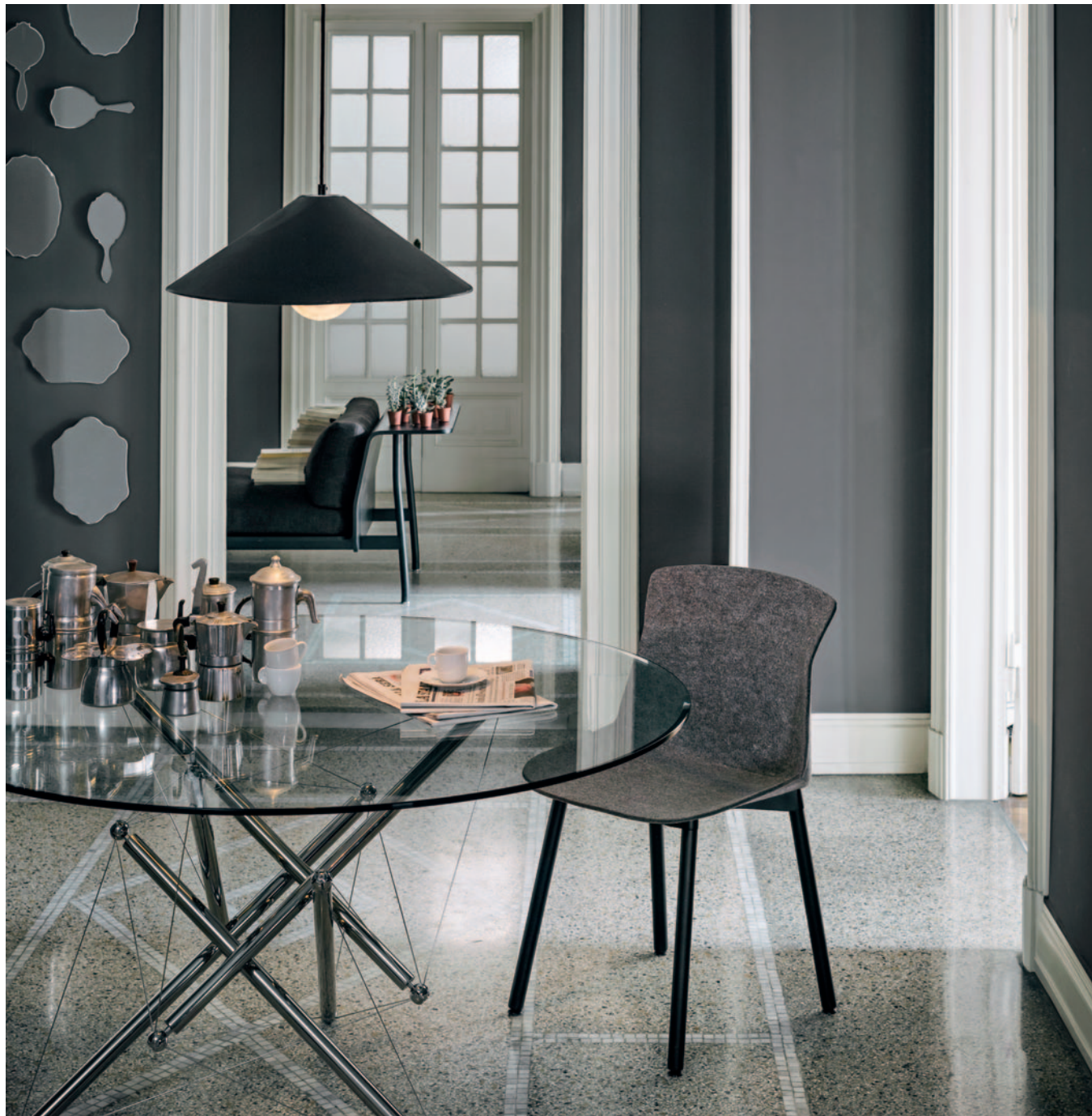
Luca Nichetto MOTEK